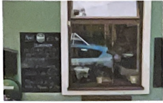
Meidlinger Markt.

Quartiertourismus und Stadtanierung – Die „grätzlhotele“ in Wien. Von Robert Fabach