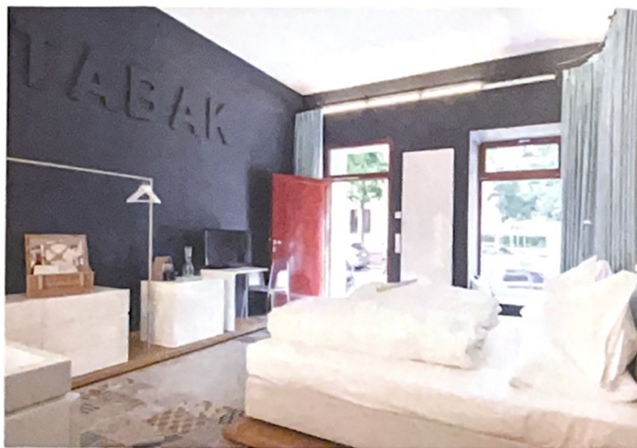
Street Suite Belvedere, Der Trafikant. Gestaltung: Büro KLK. Die Trafik ist eine echt österreichische Institution und führt Tabakwaren, Zeitungen, Schreibwaren und vieles mehr. Ein Original war auch der Vorbesitzer dieser Street Suite. Herbert Richters Abneigung gegenüber Computern wegen, schrieb er behördliche Briefe und auch das Kündigungsschreiben bevor er in Rente ging fein säuberlich per Hand.

Wie funktionieren eigentlich die „Zimmer“ oder besser Suiten in einem Geschäftslokal, wie schläft es sich eigentlich in der Auslage? Der Bestand hält natürlich Herausforderungen bereit. Die 25 bis 40 Quadratmeter großen Suiten werden entweder ausschließlich von der Straße belichtet oder liegen gänzlich zum Innenhof. Dieses Prinzip verbreitet bei vielen Gästen Begeisterung. Die zentrale