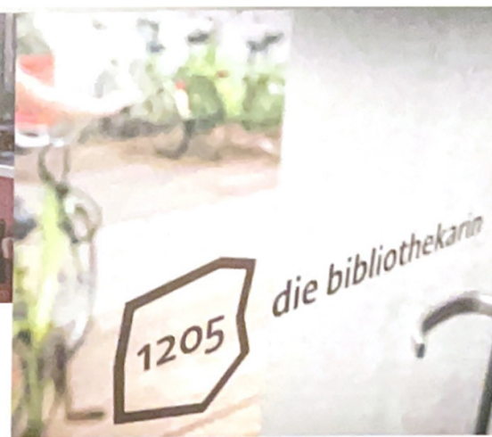
Garden Suite Meidlinger Markt, Die Bibliothekarin. Gestaltung: BWM Architekten. Jedes grätzlhotele verfügt über Leihräder, die auf unkomplizierte Weise mobil machen.