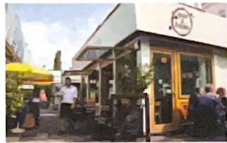
Frühstück im Cafe Ignaz und Rosalia.

Ja, die Zeit, das ist halt der Schneiderg'sell, der in der Werkstatt der Ewigkeit alles zum Ändern kriegt. Manchmal geht die Arbeit g'schwind, manchmal langsam, aber fertig wird's. G'ändert wird all's!