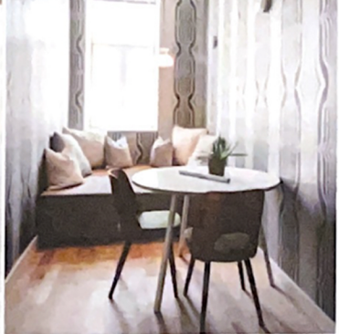
Street Suite Meidlinger Markt, Der Marktschreier. Gestaltung: BWM Architekten. Der Marktschreier ist nicht gerade ein unauffälliger Geselle und verkündet unüberhörbar, dass seine „Paradies die feschesten“, seine Gurkerl „die soizigsten“ und überhaupt bei ihm alles, was er gerade feilbietet am besten ist. Ähnlich flexibel ist auch diese Suite, die sich durch Vorhänge auf verschiedene Arten teilen und in ihrem Raumgefühl den eigenen Bedürfnissen anpassen lässt.