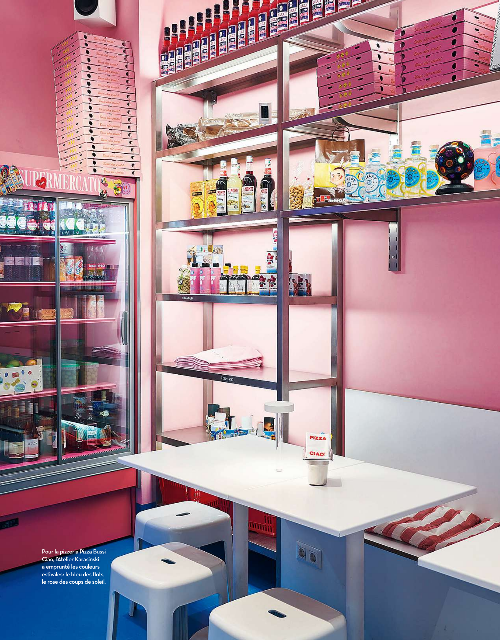
Pour la pizzeria Pizza Bussi Ciao, l'Atelier Karasinski a emprunté les couleurs estivales: le bleu des flots, le rose des coups de soleil.